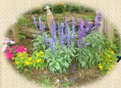
ラベンダー と メランポジウム